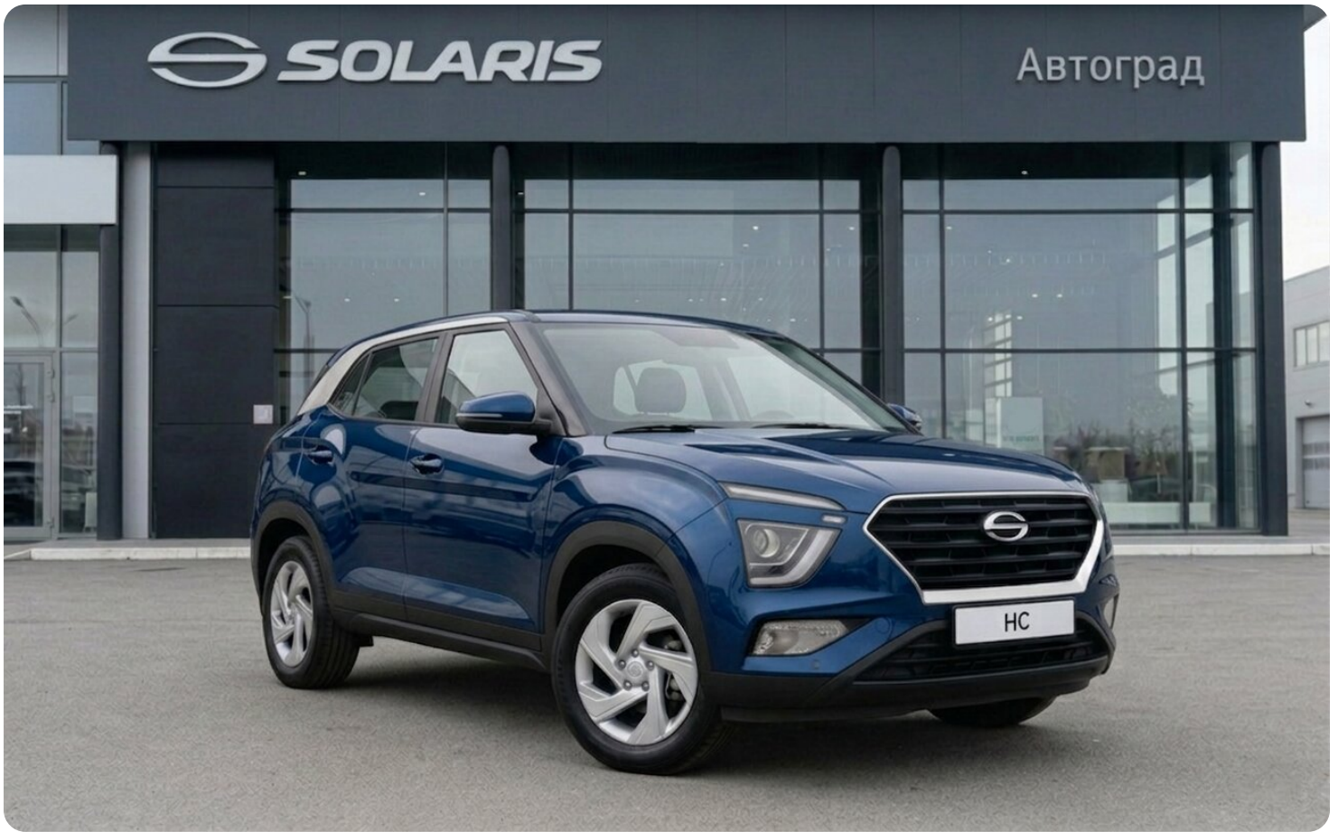
Solaris HC, I Лайфстайл (АТ)